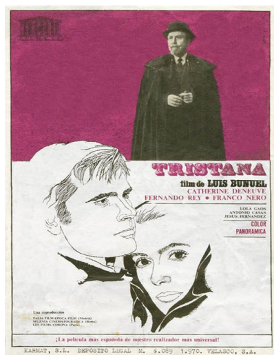
Cártel de Tristana

Desde sus orígenes, el cine español recurrió a menudo para localizar sus producciones a las ciudades y el territorio que hoy constituye CLM. Grandes películas de nuestro cine se han rodado aquí, empezando por la mayor parte de las versiones cinematográficas de Don Quijote y de otros clásicos. Por mencionar solo algunos nombres egregios: Calle mayor y La venganza (Juan Antonio Bardem), Tristana (Luis Buñuel) o La caza y Peppermint Frappé (Carlos Saura).