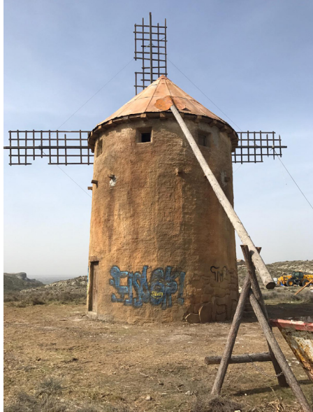
Molino de atrezzo para El hombre que mato a don Quijote, de Terry Gilliam

inversiones y la consolidación de una industria autóctona, con participación de Cultura, Economía y el ente audiovisual autonómico. Entonces, volverán a cabalgar juntos don Quijote y Sancho.